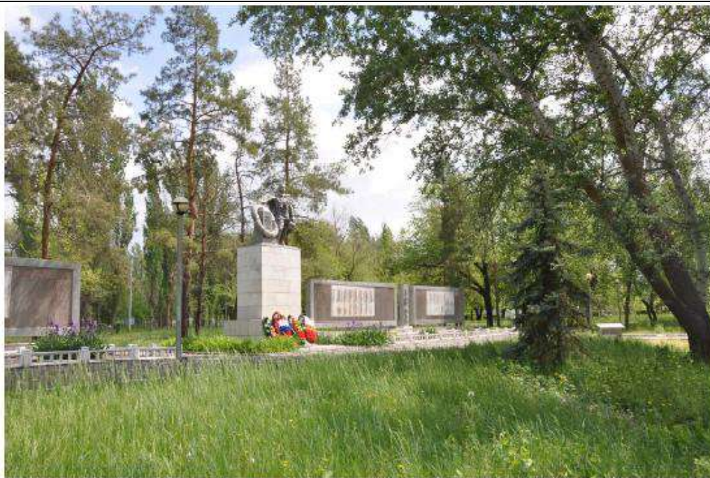
Братская могила советских воинов, погибших в период Сталинградской битвы. Общий вид на стены памяти и скульптурную композицию на постаменте с запада.