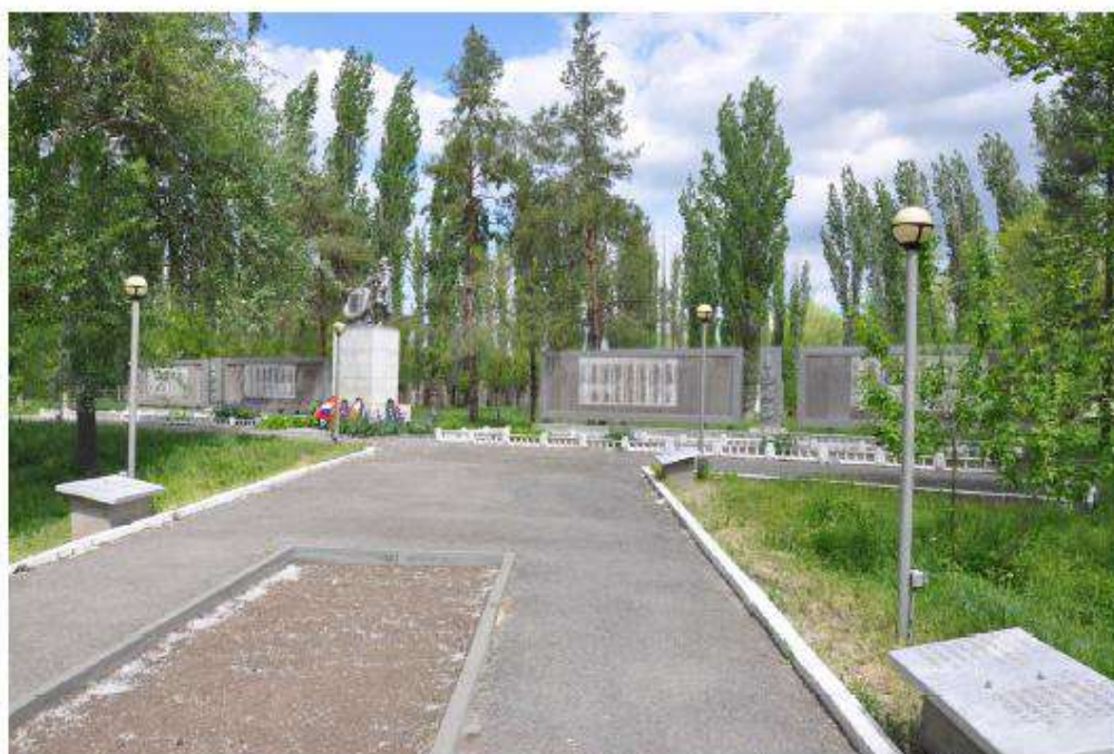
Братская могила советских воинов, погибших в период Сталинградской битвы. Общий вид на стены памяти и скульптурную композицию на постаменте с юга.