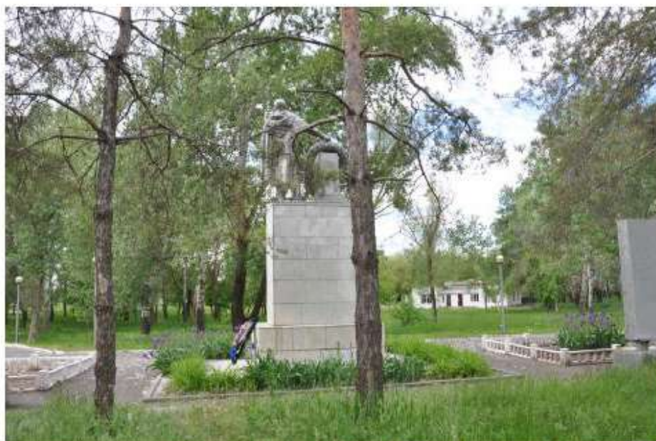
Братская могила советских воинов, погибших в период Сталинградской битвы. Общий вид на постамент со скульптурной композицией с северо-востока.