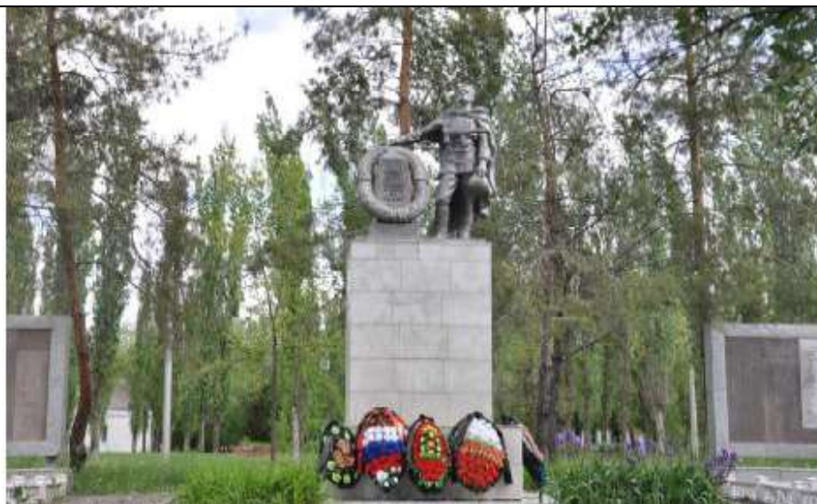
Вид на памятник.

Фотофиксация объекта культурного наследия «Братская могила советских воинов, погибших в период Сталинградской битвы», 1942-1943, 1959 гг.», расположенного по адресу: Волгоградская область, Городищенский район, совхоз «Первомайский», детский лагерь завода «Красный Октябрь» (в настоящее время – поселок «Сады Придонья», фотофиксация 2017 года