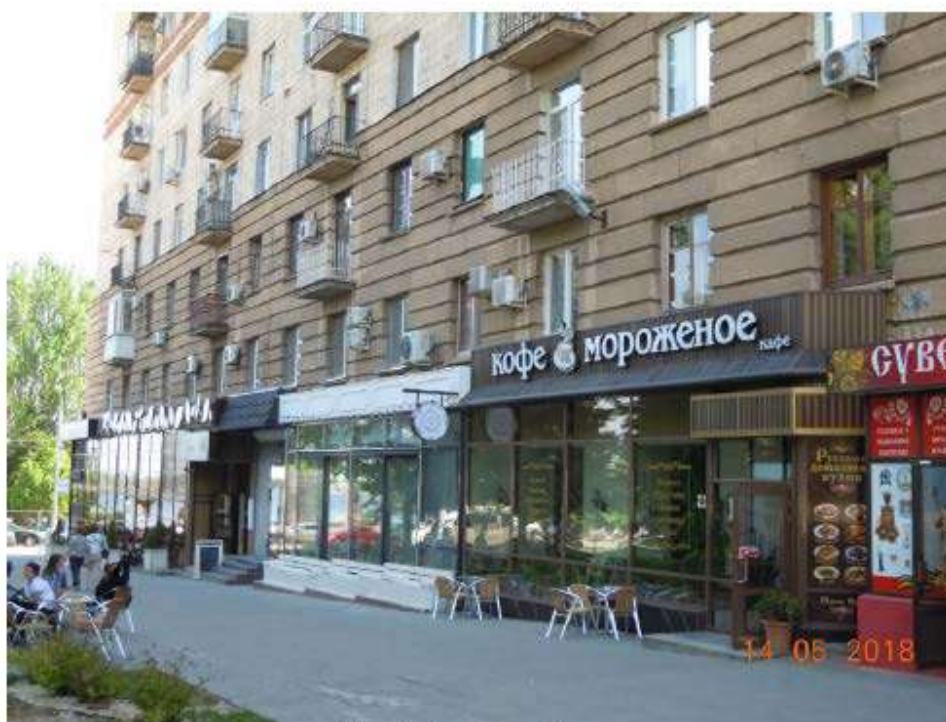
Рис. 1. Фрагмент фасада