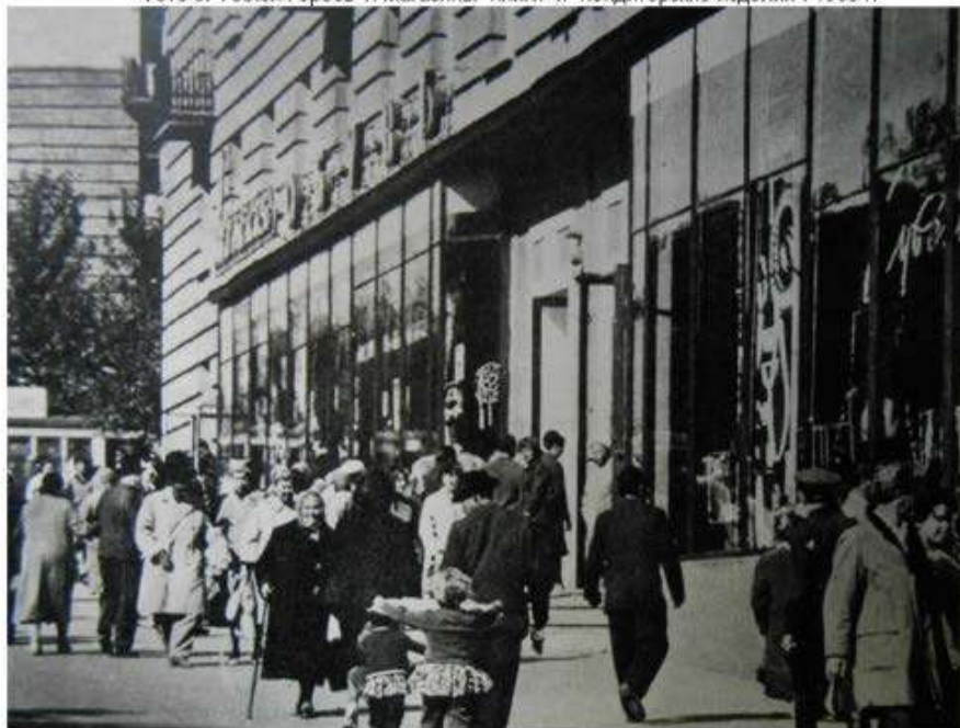
Фото 4. Аллея Героев 2 (ниже магазин Берёзка). 1966 г.