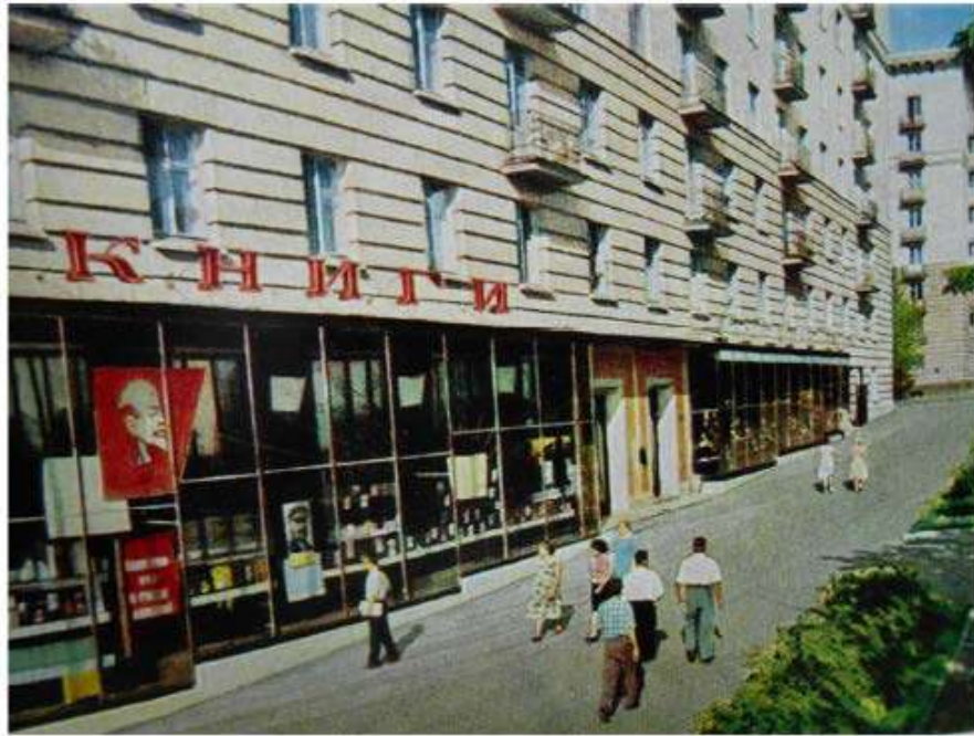
Фото 3. Аллея Героев 1. Магазины "Книги" и "Кондитерские изделия". 1963 г.