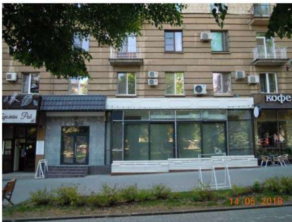
Рис. 2. Фрагмент фасада