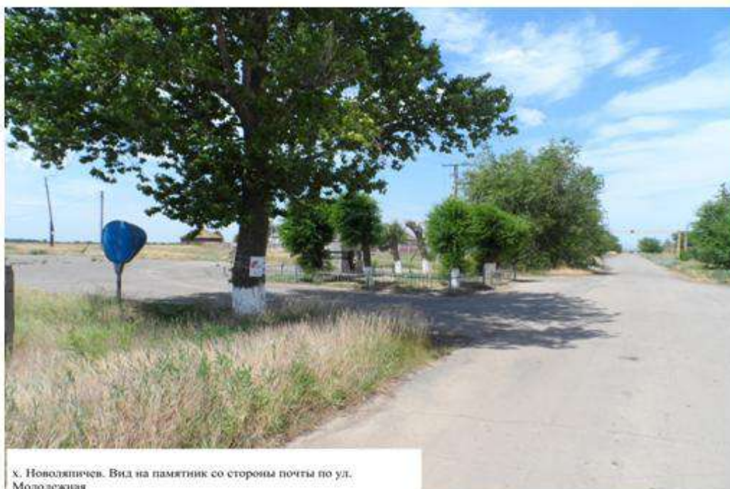
х. Новолыничев. Вид на памятник со стороны почты по ул. Молодежная