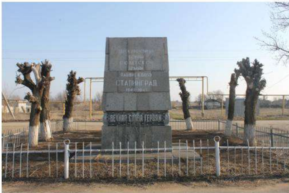
Фотофиксация объекта культурного наследия по состоянию на 2020 год