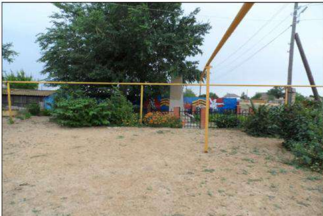
Фотофиксация объекта культурного наследия по состоянию на 2020 год