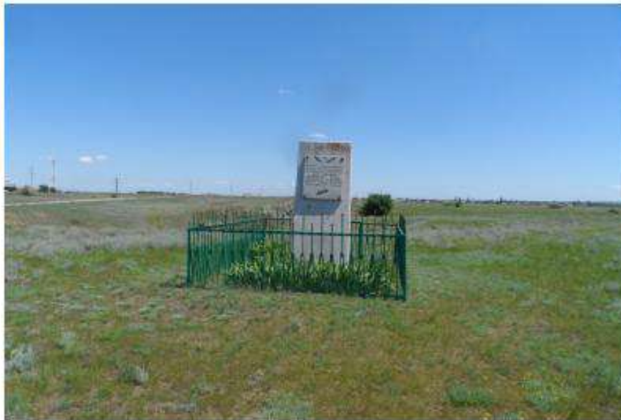
Вид на памятник с фасадной части примерно в 7 метрах по направлению на восток.