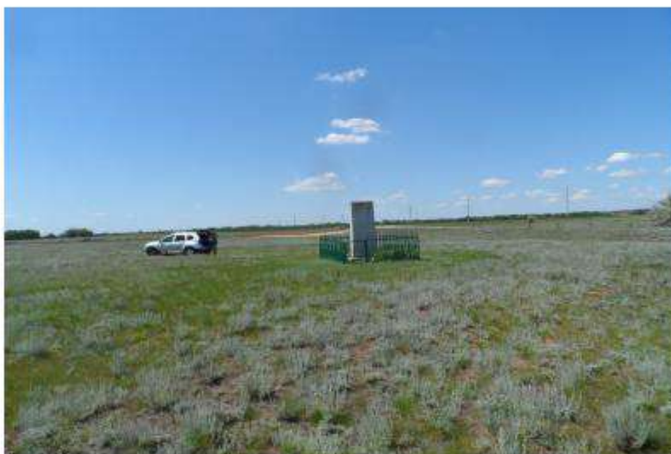
Вид на памятник со стороны поля, примерно в 18 метрах по направлению на северо-запад.