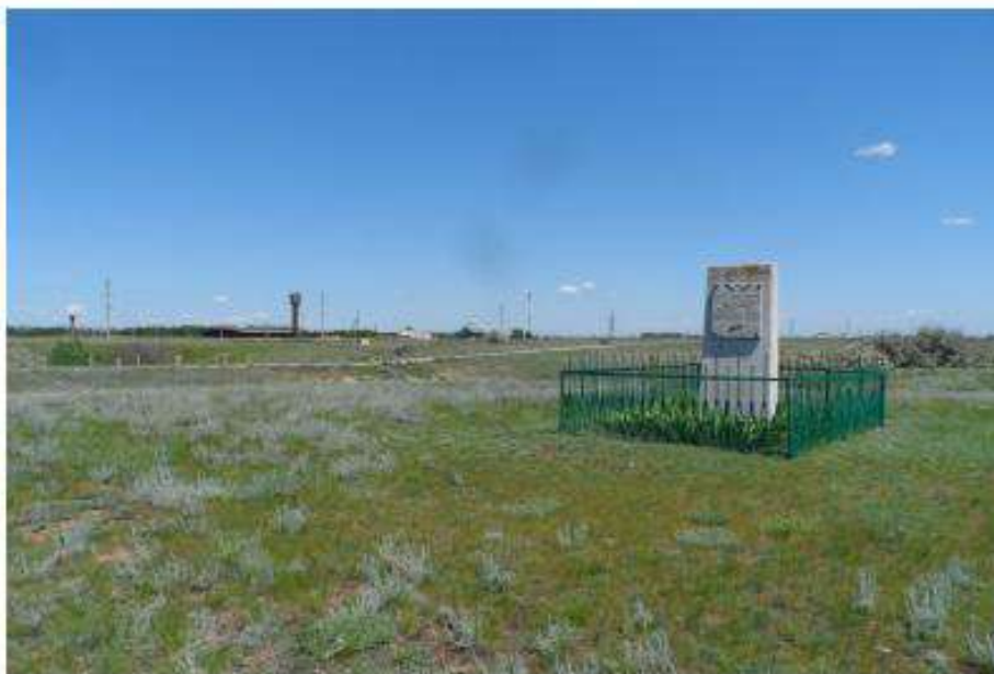
Вид на памятник со стороны дороги, ведущей на кладбище с. Мариновка, примерно в 10 метрах по направлению на северо-восток.