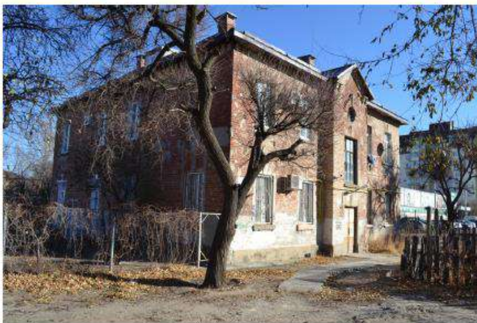
Фото 5. Вид с на входящий в состав объекта культурного наследия дом по адресу ул. Пельше, 12. Дата съемки: ноябрь 2020.