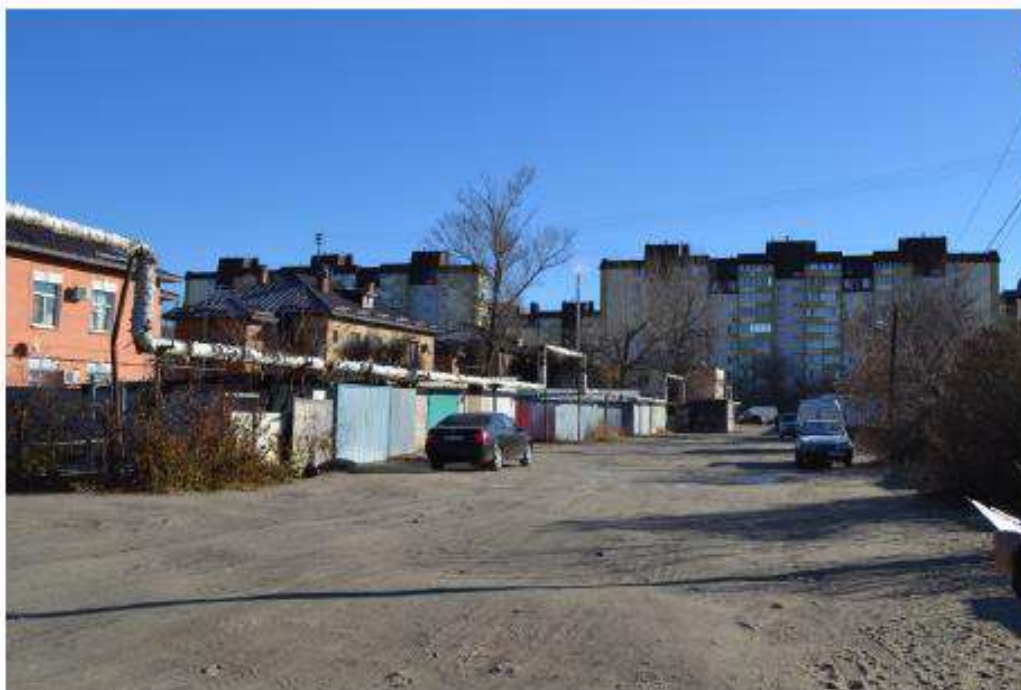
Фото 48. Вид на территорию объекта культурного наследия. Дата съемки: ноябрь 2020.