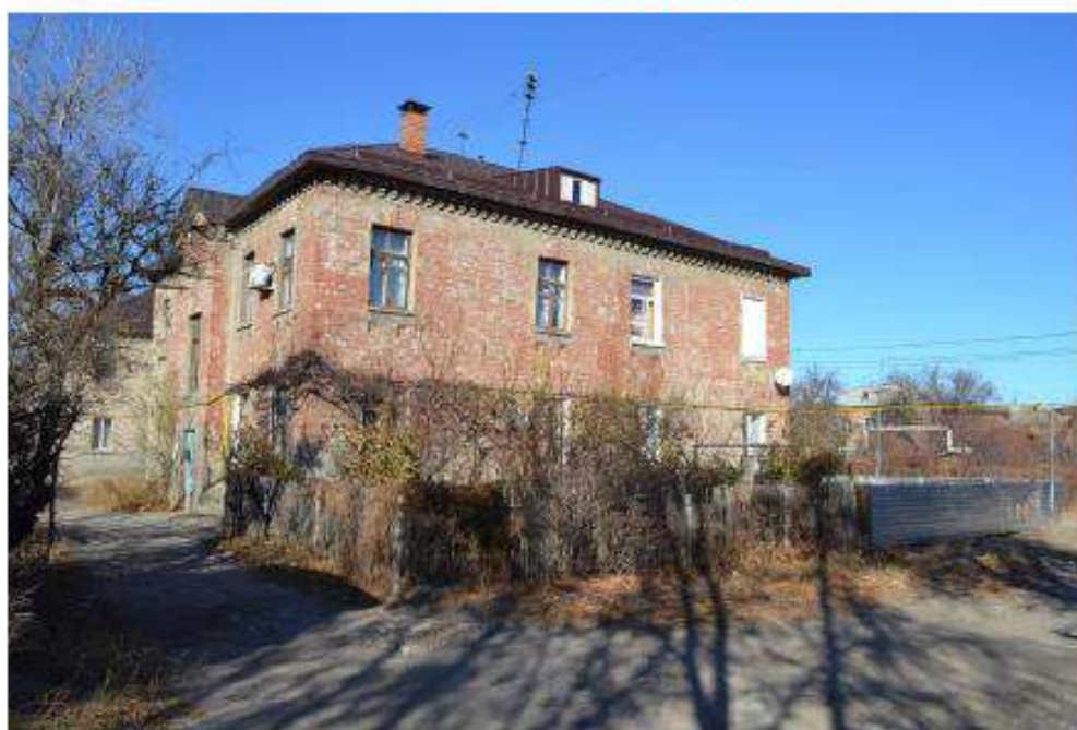
Фото 6. Вид на входящий в состав объекта культурного наследия дом по адресу ул. Пельше, 14. Дата съемки: ноябрь 2020.