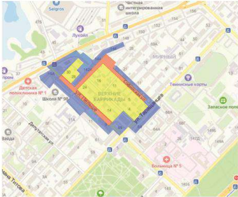
Карта (схема) гранц территорий зон охраны объекта культурного наследия регионального значения «Дома жилые», до 1917 г., восст.1946 г., расположенного по адресу: Волгоградская область, г. Волгоград, квартал по ул. Еременко-Пельше- Софийской-Геленджикской