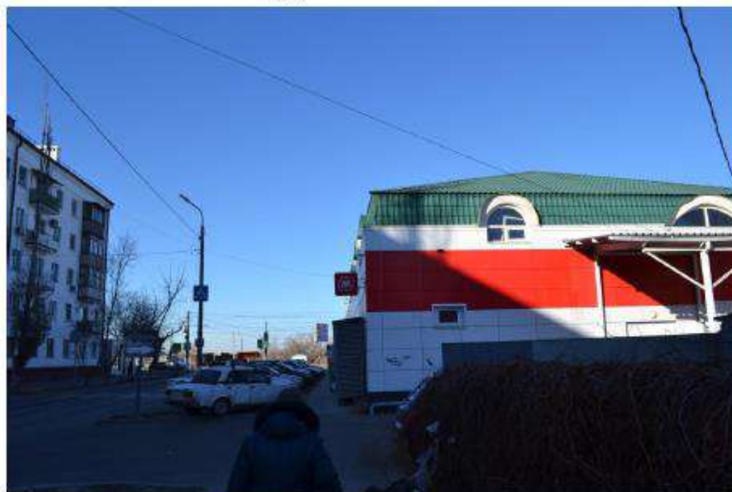
Фото 20. Вид на территорию, примыкающую к объекту культурного наследия в северной части. Дата съемки: ноябрь 2020.