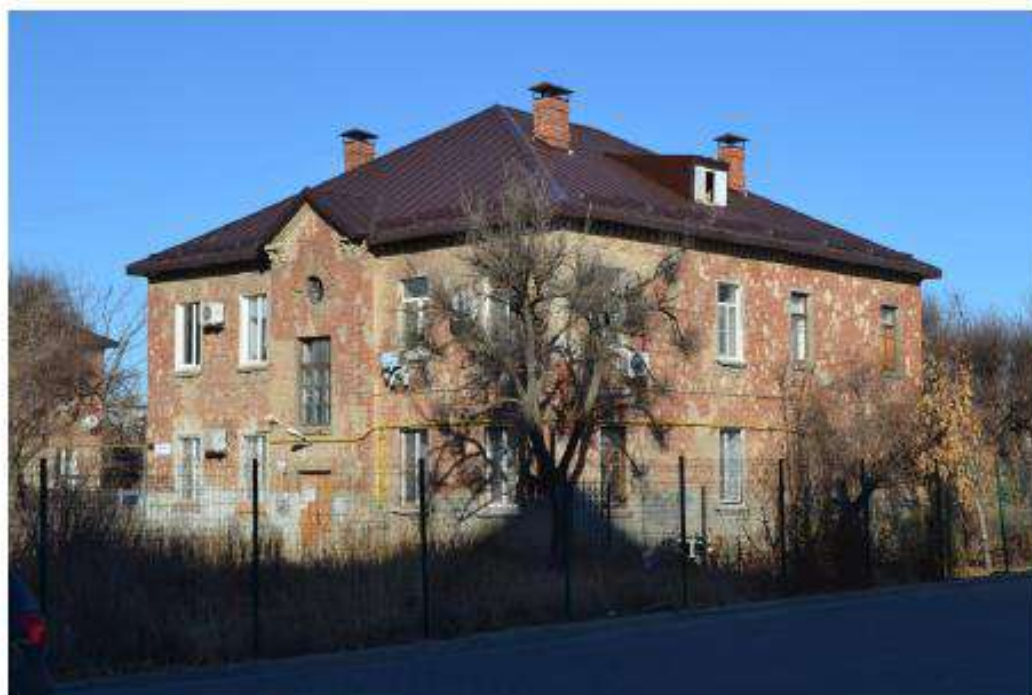
Фото 4. Вид на входящий в состав объекта культурного наследия дом по адресу ул. Пельше,

Дата съемки: ноябрь 2020.