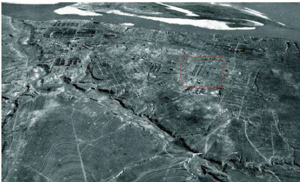
Дома жилые постройки до 1917 г. на аэрофотосъемке 1942 года.