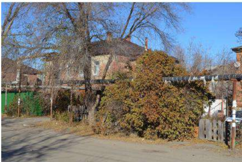
Фото 47. Вид на входящий в состав объекта культурного наследия дом по адресу ул. Геленджикская, 12. Дата съемки: ноябрь 2020.