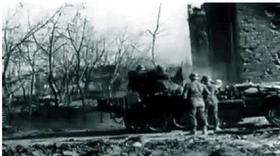
Бои на территории поселка. Кадр немецкой кинохроники 1942 года.