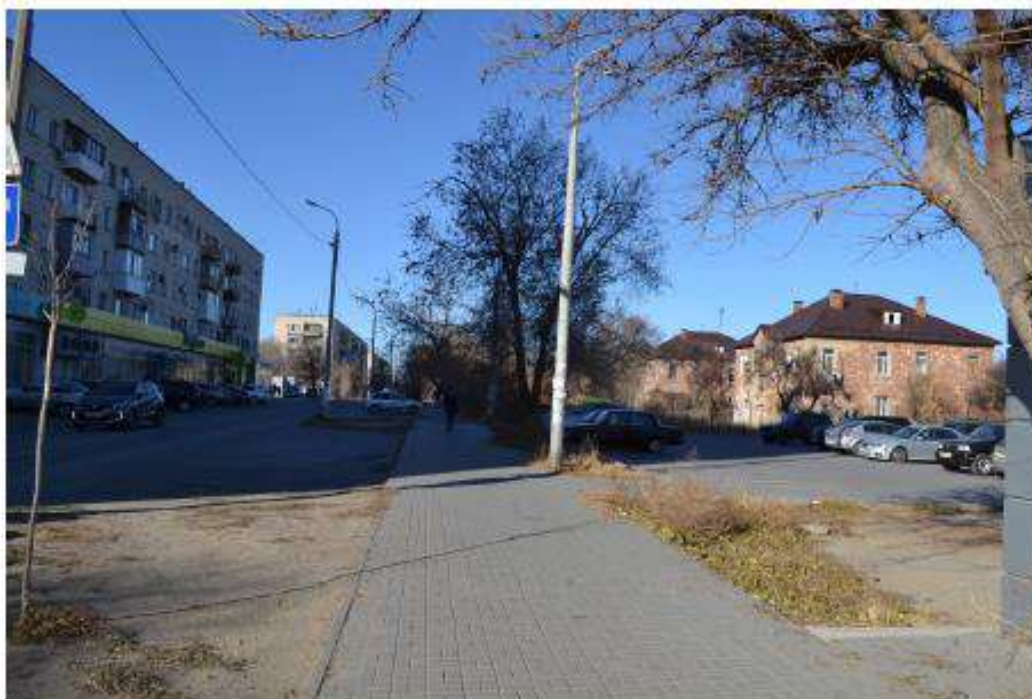
Фото 3. Вид на восточную границу территории объекта культурного наследия с юго-запада.

Дата съемки: ноябрь 2020.