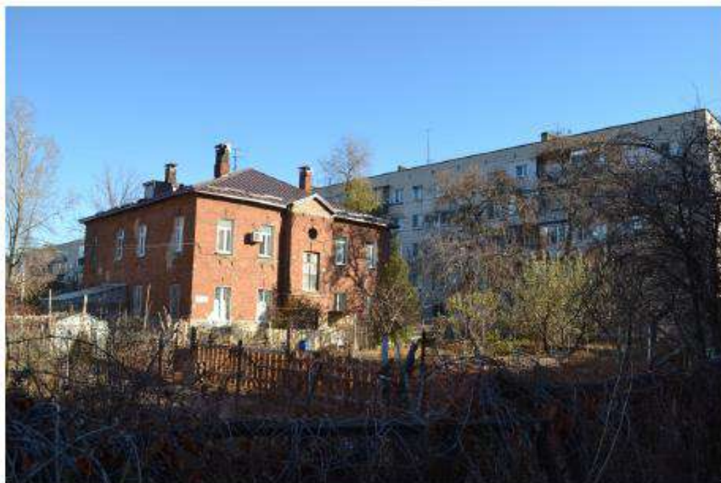
Фото 19. Вид на территорию объекта культурного наследия. Дата съемки: ноябрь 2020.