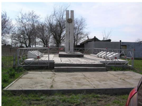
Фото объекта культурного наследия из ЕГР ОКН, № 341510320990005

По окраинам Песчанки проходила линия ближнего оборонительного обвода Сталинграда. Бои здесь начались в первых числах сентября и отличались большим масштабом привлечения сил и ожесточённостью. После прорыва рубежа 8 сентября 1942 года, немецкие войска двинулись в дальше в сторону центра Сталинграда и Бекетовки. Почти пять месяцев Песчанка находилась под оккупацией гитлеровских войск. Ближе всего от посёлка, в 6 километрах, находились рубежи 64-й армии. Немецкие и румынские войска обустроили здесь тыл, соорудили много блиндажей и надеялись провести тут зиму. Ямы от блиндажей до сих пор хорошо видны на склонах балок и оврагов вокруг посёлка.