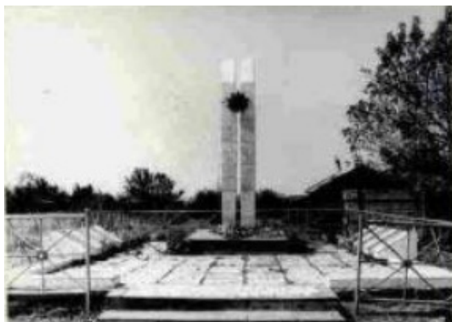
Фото из учетной карточки воинского захоронения, 13.08.1991 г.