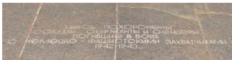
Стилизованный Вечный огонь. Мемориальная надпись на надгробной плите. Дата съемки: 19.08.2020 г.