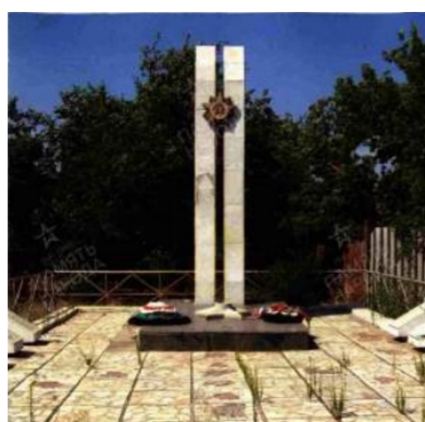
Фото из учетной карточки воинского захоронения, 22.07.2014 г.