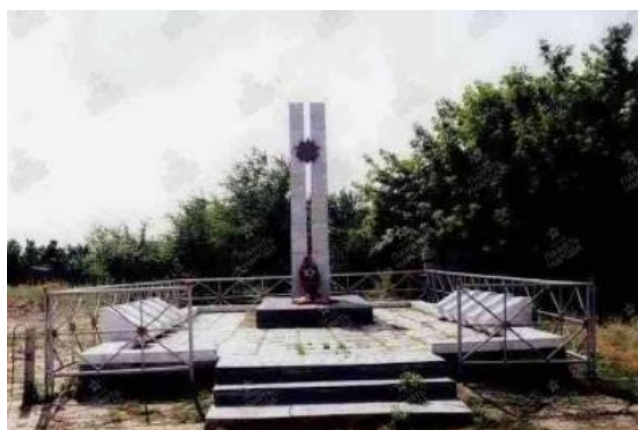
Фото из учетной карточки воинского захоронения, 01.09.1998 г.