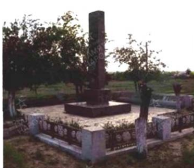
Фото из учетной карточки воинского захоронения, 22.07.2014 г.