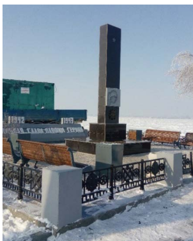
Общий вид на братскую могилу и прилегающую территорию. Дата съемки: 20.01.2022 г.