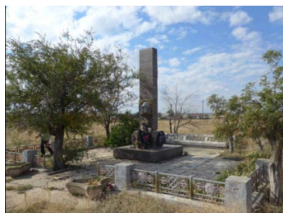
Фото с сайта ВООПИиК. Дата съемки: первая половина 2000-х гг.

Фото из учетной карточки воинского захоронения, 13.08.1991 г.