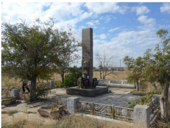
Фото объекта культурного наследия из ЕГР ОКН, № 341510320950005

«Братская могила советских воинов, погибших в период Сталинградской битвы» расположена сразу перед въездом в посёлок. Это одна из двух больших братских могил, в которой после окончания Сталинградской битвы были перезахоронены останки советских воинов, погибших в окрестностях Песчанки. Большая их часть погибли в январе 1943 г. при освобождении Песчанки (22.01.1943 г. советские войска освободили Песчанку), но есть и те, кто погиб в сентябрьских боях и даже раньше - от бомбардировок.