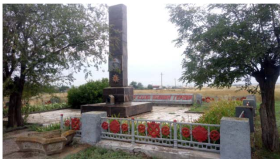
Памятник. с. Песчанка, северная окраина. Дата съемки: 19.08.2020 г.