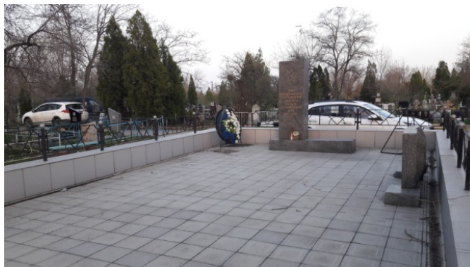
Общий вид на стелы на братской могиле. Дата съемки: 16.04.2022 г.

На горизонтальной стеле (слева) надпись: «Подвиги ваши бессмертны».