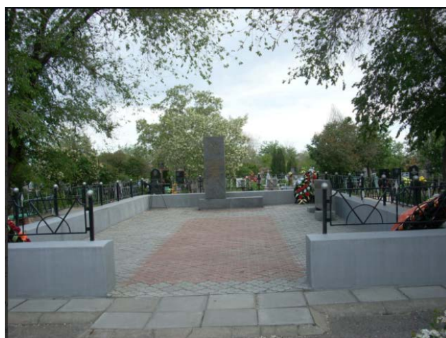
Вид на братскую могилу. Дата съемки: 2000-е гг.