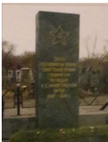
Братская могила воинов советской армии, погибших в боях за Сталинград. Дата съемки 1990-е гг.