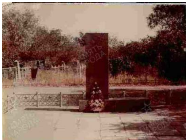
Фото из учетной карточки воинского захоронения, 30.08.1991 г.