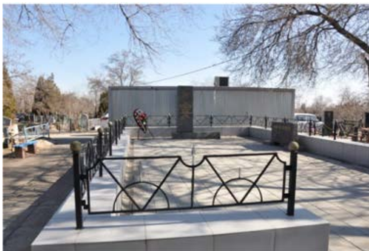
Фото объекта культурного наследия из ЕГР ОКН, № 341610725760005

В августе – сентябре 1942 года на территории, где в настоящее время располагается Алюминиевый завод и «Алюминиевское кладбище» проходил северный рубеж обороны Сталинграда, который защищали 1077 зенитный артиллерийский полк, 21-й и 28-й учебные танковые батальоны, 282-й стрелковый полк 10-й дивизии НКВД, части народного ополчения и истребительные батальоны, 738-й истребительно-противотанковый артиллерийский полк, сводный батальон и корабли Волжской военной флотилии, 115-я, 124-я, 149-я отдельные стрелковые бригады, 249-й конвойный полк НКВД, 724-й стрелковый полк 315-й стрелковой дивизии, 2-я мотострелковая бригада.