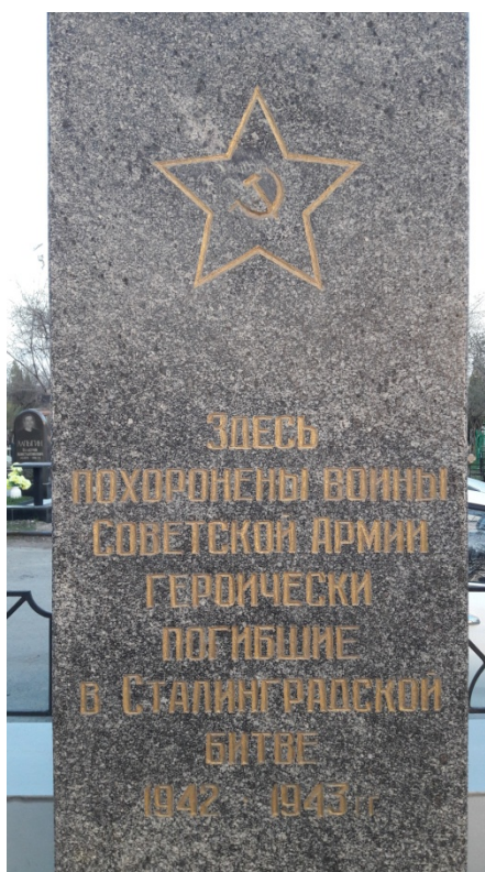
Надпись на стеле на братской могиле. Дата съемки: 16.04.2022 г.