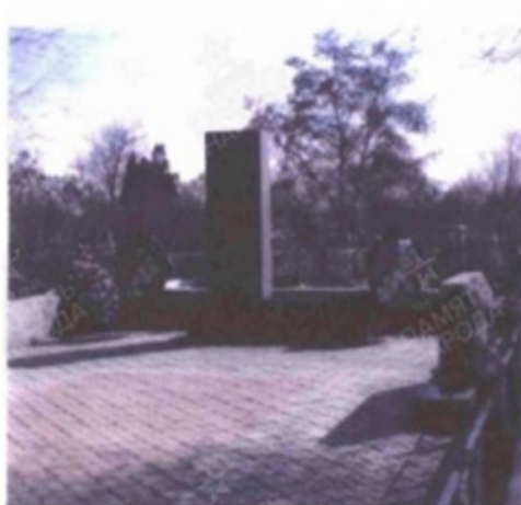
Фото из учетной карточки воинского захоронения, 01.09.2014 г.