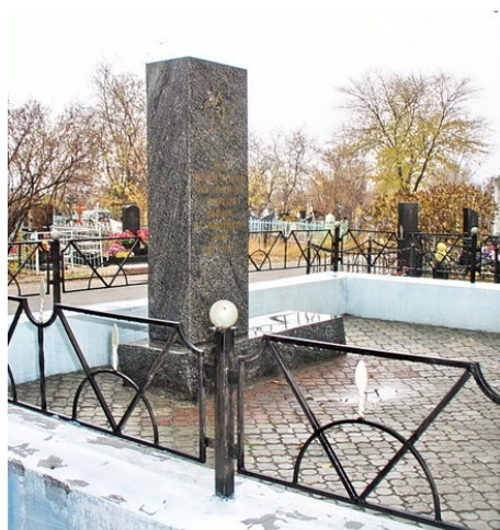
Вид на братскую могилу. Дата съемки: 2010-е гг.