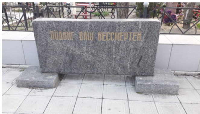
Стела с надписью (слева от памятника). Дата съемки: 16.04.2022 г.