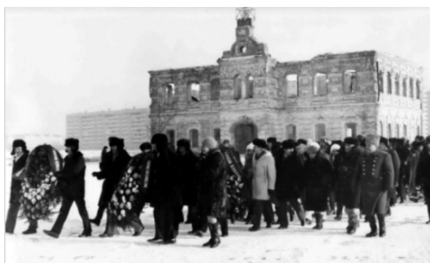
Возложение венков к памятнику на «Братской могиле участников Гражданской войны и советских воинов, погибших в период Сталинградской битвы». В 1990-е гг. в здании рядом с памятником (на фото – на заднем плане) была открыта картинная галерея. Дата съемки: 02.02.1978 г.