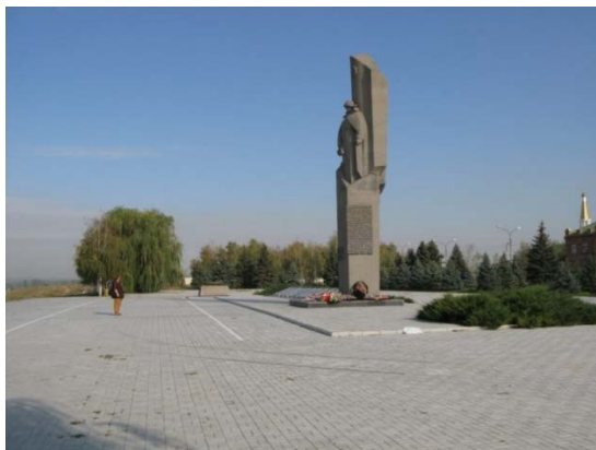
Фото объекта культурного наследия из ЕГР ОКН, № 341710769620005

После революции 1917 г. В Заволжье шла ожесточенная классовая борьба. Проводимые в жизнь мероприятия Советской власти вызывали яростное сопротивление со стороны кулаков и бывших чиновников.