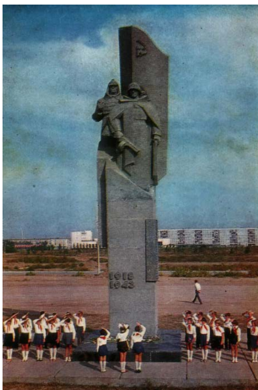
Вид на памятник в северо-восточном направлении. Дата съемки: 1976-1978 гг.

"ВАМ, БЕССМЕРТНЫМ БОРЦАМ ЗА ВЛАСТЬ СОВЕТОВ, ЗА ПЕРВУЮ ОТЧИЗНУ СОЦИАЛИЗМА. ВАМ, НЕ ЗНАВШИМ СТРАХА В БОРЬБЕ ЗА СЧАСТЬЕ НАРОДА, ВАМ, ПОБЕДИВШИМ ХОЛОД, ГОЛОД, РАЗРУХУ И НЕСМЕТНЫЕ СОНМИЩА ВРАГОВ, ВАМ, БЕСПРЕДЕЛЬНО ПРЕДАННЫМ ПАРТИИ, НАРОДУ, РОДИНЕ. ВАМ, МЕЧТАВШИМ О ЯСНОМ НЕБЕ, СОЛНЦЕ, О ВЕЧНОМ МИРЕ НА ЗЕМЛЕ, ВАМ, ЧЬЕ ДЕЛО ПРОДОЛЖАЕТ НАШЕ ПОКОЛЕНИЕ, ВОЗДВИГЛИ ЭТОТ ПАМЯТНИК БЛАГОДАРНЫЕ ВОЛЖАНЕ. ВЕЧНАЯ ВАМ СЛАВА. 9 МАЯ 1975 ГОДА"