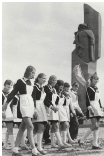
Пионерия г. Волжский. На заднем плане – «Братская могила участников Гражданской войны и советских воинов, погибших в период Сталинградской битвы». Дата съемки: 19.05.1977 г.