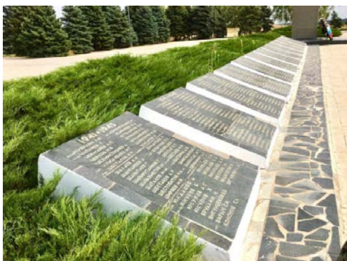
Мемориал гражданской и Великой Отечественной войны «Безымянным жертвам войны» 13 мемориальных плит. Дата съемки: 2019 г.