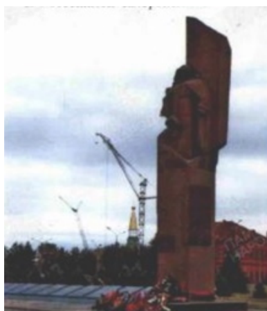
Фото из учетной карточки воинского захоронения, 2014 г.