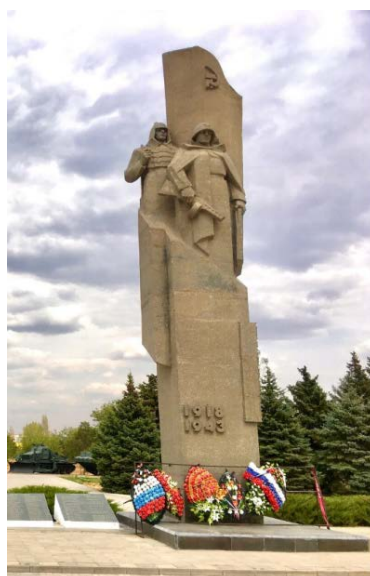
Дата съемки: 2000-е гг.