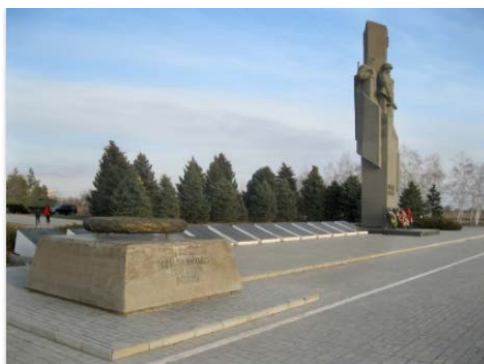
Рядом с обелиском находится 13 тумб с именами погибших. И отдельная тумба с бронзовым венком и надписью: «БЕЗЫМЯННЫМ ЖЕРТВАМ ВОЙНЫ». Дата съемки: 2015 г.