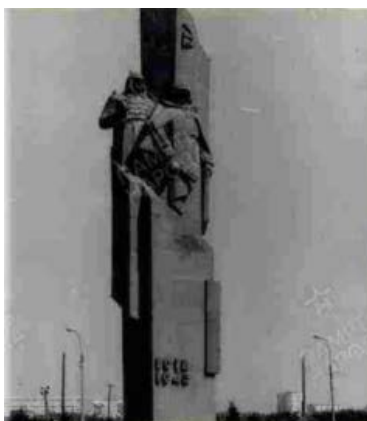
Фото из учетной карточки воинского захоронения, 25.08.1991 г.