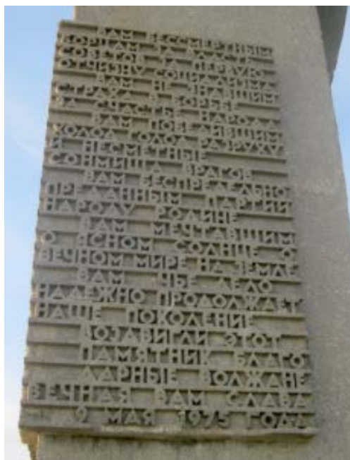
Надпись на юго-западной грани обелиска:

"ВАМ, БЕССМЕРТНЫМ БОРЦАМ ЗА ВЛАСТЬ СОВЕТОВ, ЗА ПЕРВУЮ ОТЧИЗНУ СОЦИАЛИЗМА. ВАМ, НЕ ЗНАВШИМ СТРАХА В БОРЬБЕ ЗА СЧАСТЬЕ НАРОДА, ВАМ, ПОБЕДИВШИМ ХОЛОД, ГОЛОД, РАЗРУХУ И НЕСМЕТНЫЕ СОНМИЩА ВРАГОВ, ВАМ, БЕСПРЕДЕЛЬНО ПРЕДАННЫМ ПАРТИИ, НАРОДУ, РОДИНЕ. ВАМ, МЕЧТАВШИМ О ЯСНОМ НЕБЕ, СОЛНЦЕ, О ВЕЧНОМ МИРЕ НА ЗЕМЛЕ, ВАМ, ЧЬЕ ДЕЛО ПРОДОЛЖАЕТ НАШЕ ПОКОЛЕНИЕ, ВОЗДВИГЛИ ЭТОТ ПАМЯТНИК БЛАГОДАРНЫЕ ВОЛЖАНЕ. ВЕЧНАЯ ВАМ СЛАВА. 9 МАЯ 1975 ГОДА"