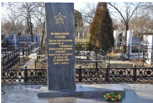
Братская могила советских воинов. Фото объекта культурного наследия из ЕГР ОКН, № 341721168340005

В первые месяцы войны в Сталинграде было развернуто более 100 эвакуогоспиталей. В том числе на территории Дзержинского и Ерманского (Центрального) районов к началу 1942 г. размещалось 39 эвакуогоспиталей. Умерших от ран и болезней хоронили на гражданских кладбищах и в различных местах города, где для этого отводились специальные участки или отдельные места. В 1967-1972 гг. разрозненные одиночные и братские захоронения на Центральном кладбище, а также некоторые захоронения, обнаруженные в различных местах территории города, в неблагоустроенных местах района, были перенесены в братскую могилу. Это останки 62 воинов, павших в боях, и 370 офицеров, сержантов и солдат, умерших от ранений. Установлены имена 257 захороненных.