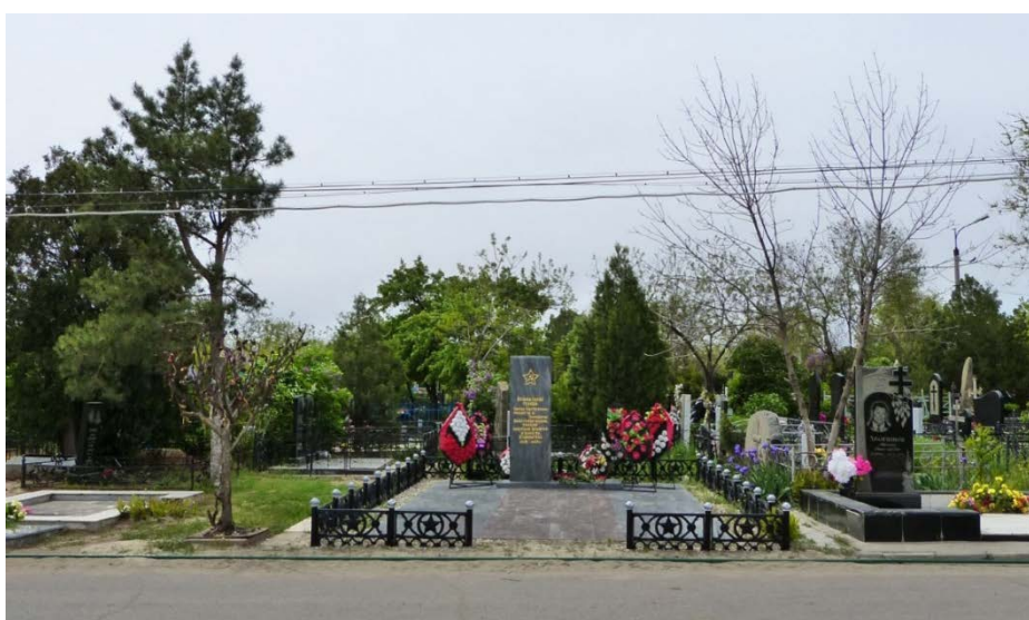
Общий вид на памятник. Дата съемки: май 2022 г.