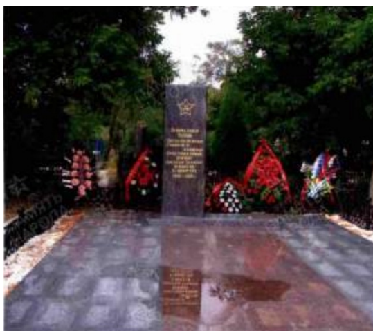
Фото из учетной каточки воинского захоронения, 09.09.2014 г.