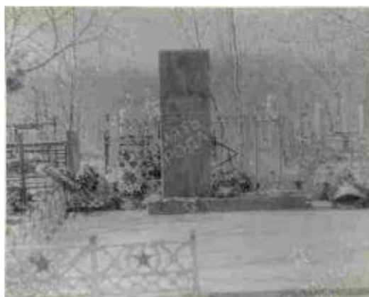
Фото из учетной карточки воинского захоронения, 15.07.1991 г.

Центральное гражданское кладбище. Дата съемки: до 1991 г.