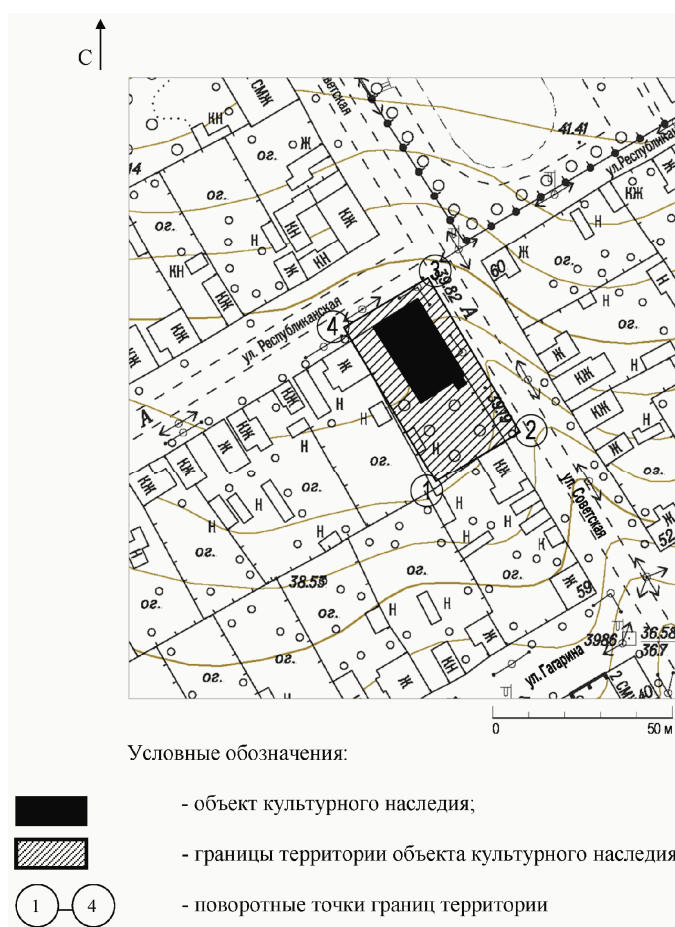
СХЕМА ГРАНИЦ ТЕРРИТОРИИ ОБЪЕКТА КУЛЬТУРНОГО НАСЛЕДИЯ РЕГИОНАЛЬНОГО ЗНАЧЕНИЯ "ДОМ КРЮЧКОВА", 1887 Г., РАСПОЛОЖЕННОГО ПО АДРЕСУ: ВОЛГОГРАДСКАЯ ОБЛАСТЬ, Г. ДУБОВКА, УЛ. СОВЕТСКАЯ, 19

Приложение 2 к приказу министерства культуры Волгоградской области от 19 января 2015 г. N 01-20/020