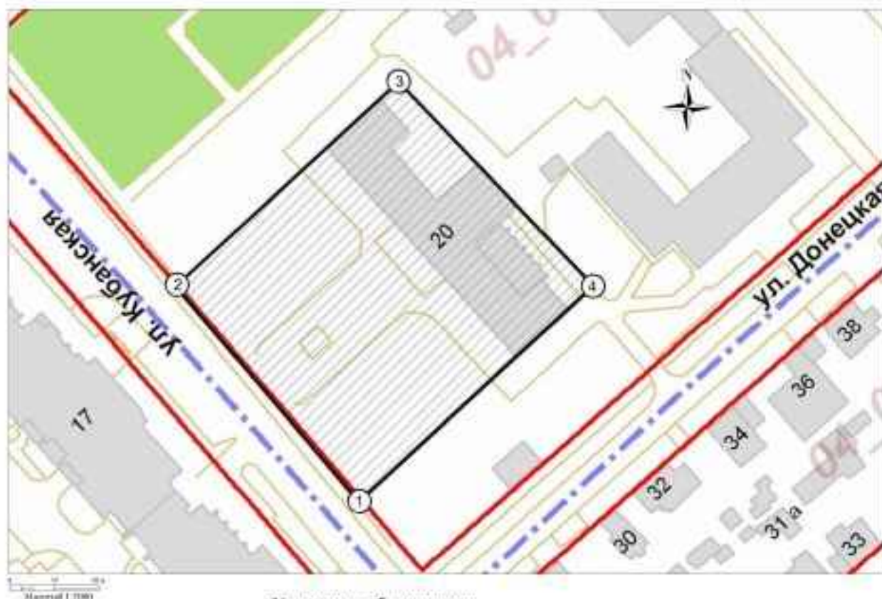
Схема границ территории объекта культурного наследия регионального значения «Место, где размещался штаб 8-й воздушной армии» г. Волгоград, Центральный район, ул. Кубанская, школа-интернат № 1