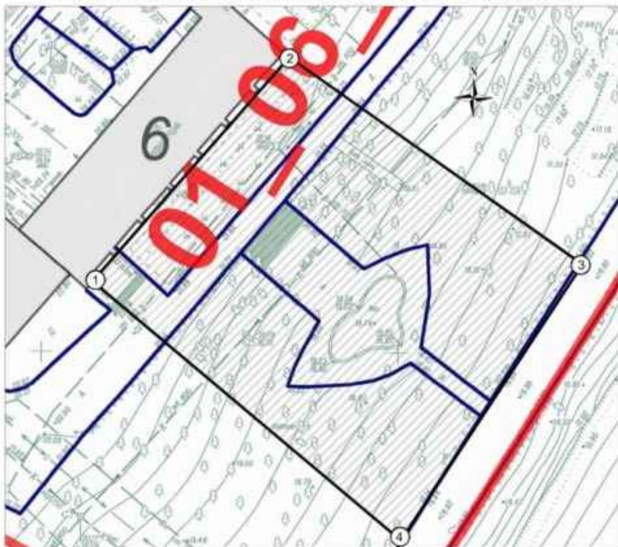
Схема границ территории объекта культурного наследия «Место, где размещался командный пункт 124-й отдельной стрелковой бригады и группы войск полковника Горохова С.Ф.», октябрь – ноябрь 1942 г.