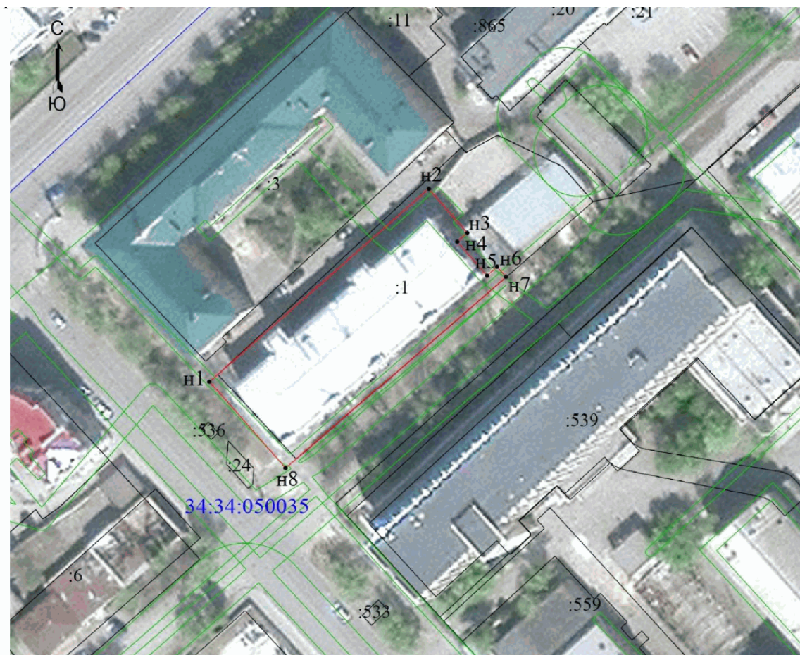
Ситуационный план местоположения объекта культурного наследия регионального значения "Школа (институт усовершенствования учителей)", расположенного по адресу: Волгоградская область, г. Волгоград, ул. Огарева, 6