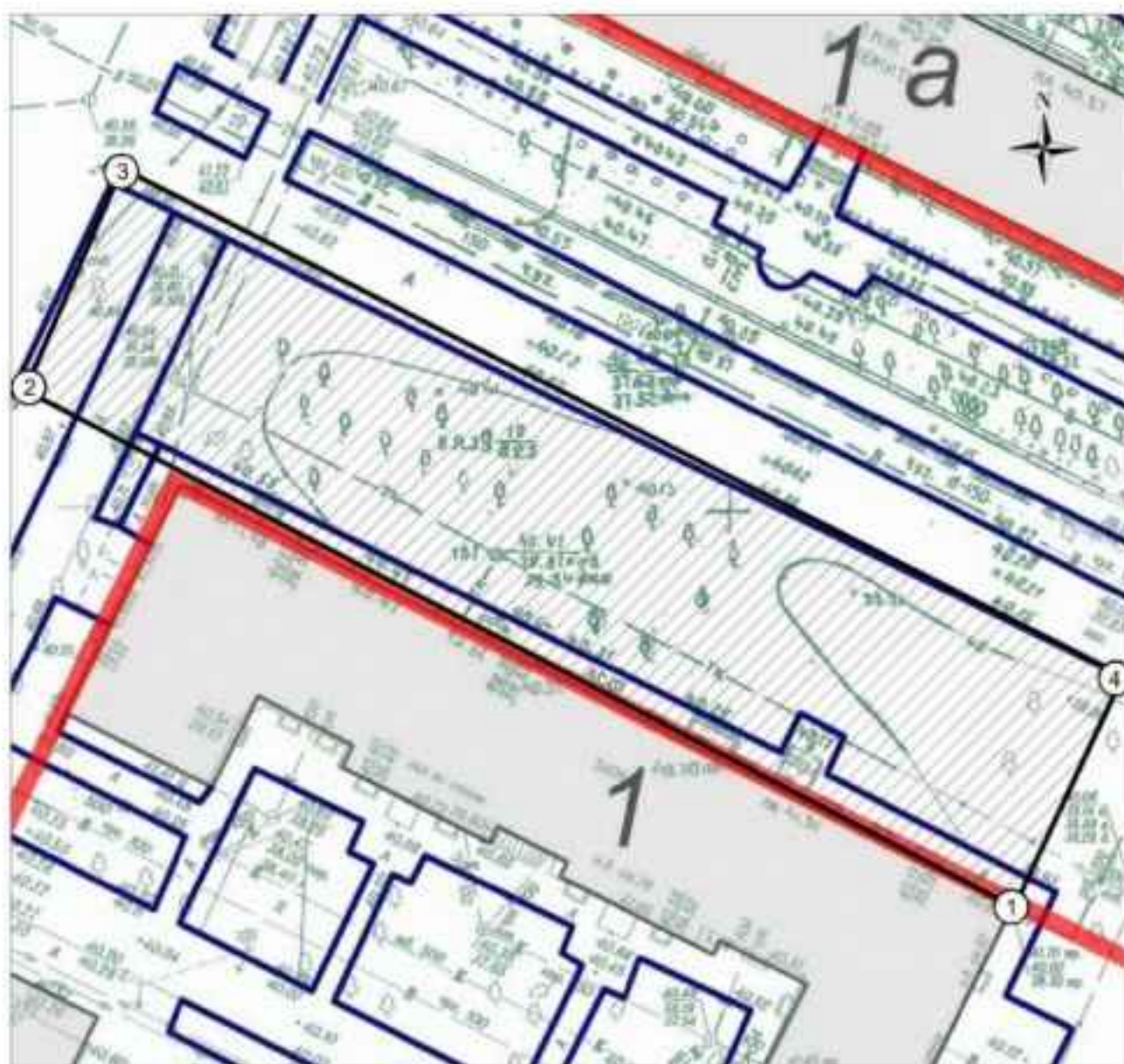
Схема границ территории объекта культурного наследия «Место боев воинов 116-й стрелковой дивизии в дни Сталинградской битвы», 1942 – 1943 гг.

Приложение № 2 к приказу министерства культуры Волгоградской области от 23/11 2012 г. № 01-20/401