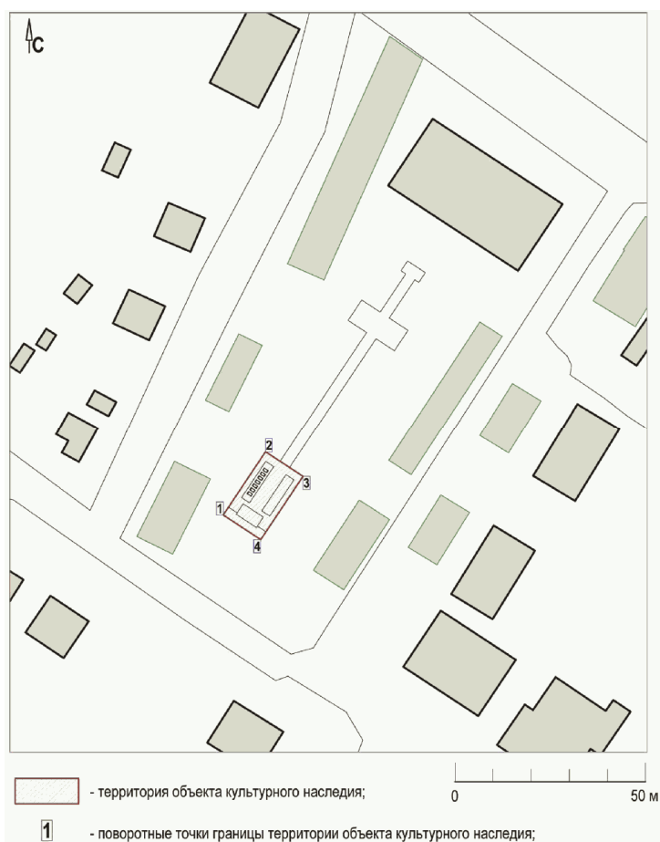
СХЕМА ГРАНИЦ ТЕРРИТОРИИ ОБЪЕКТА КУЛЬТУРНОГО НАСЛЕДИЯ РЕГИОНАЛЬНОГО ЗНАЧЕНИЯ "БРАТСКАЯ МОГИЛА УЧАСТНИКОВ ГРАЖДАНСКОЙ ВОЙНЫ, ПОГИБШИХ В БОРЬБЕ ЗА ВЛАСТЬ СОВЕТОВ", РАСПОЛОЖЕННОГО ПО АДРЕСУ: ВОЛГОГРАДСКАЯ ОБЛАСТЬ, НИКОЛАЕВСКИЙ РАЙОН, С. ПОЛИТОТДЕЛЬСКОЕ, УЛ. МИРА

Приложение 2 к приказу министерства культуры Волгоградской области от 23 декабря 2013 г. N 01-20/455