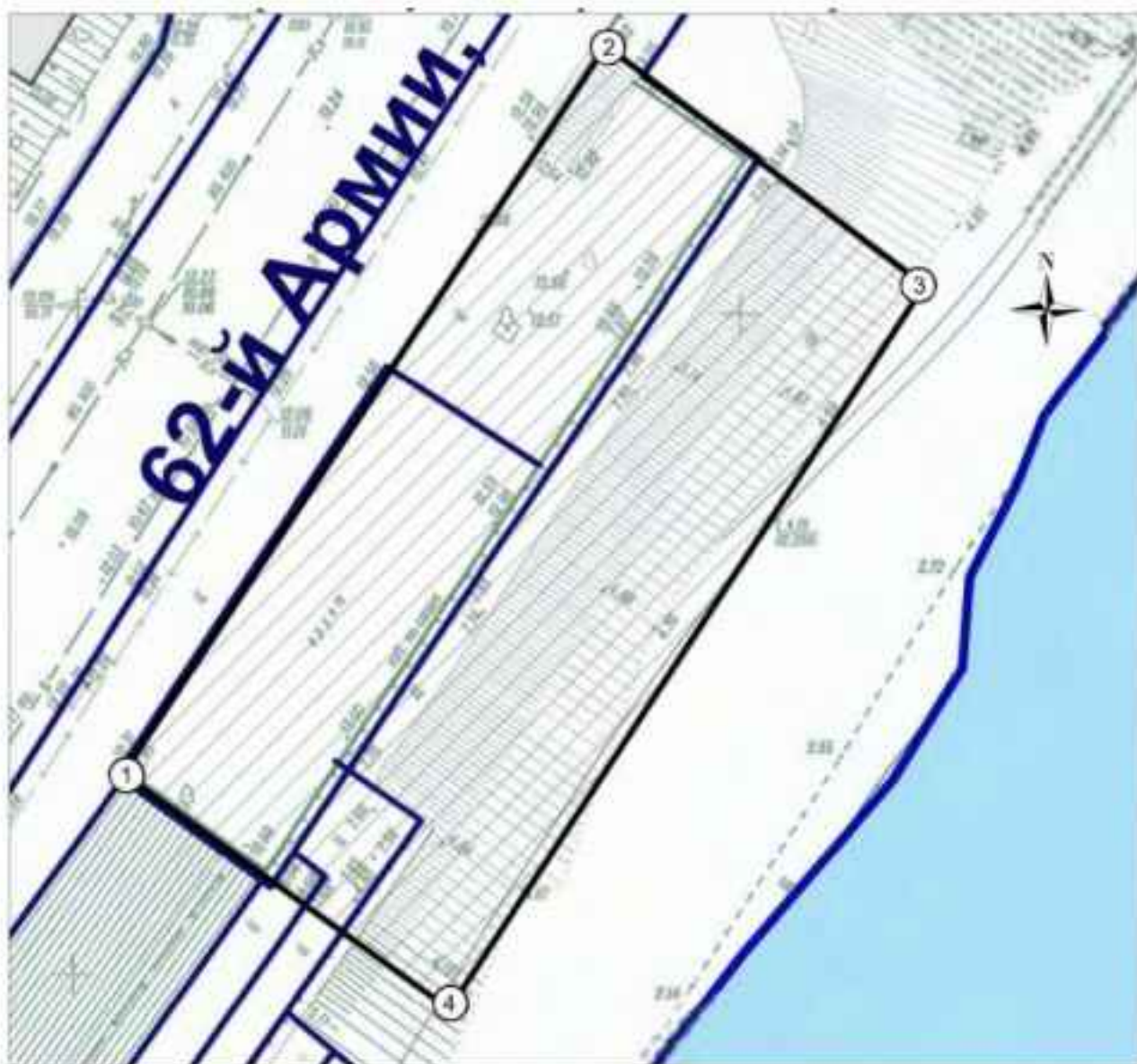
Схема границ территории объекта культурного наследия регионального значения «Опорная стена» - место боев 13-й гвардейской стрелковой дивизии 62-й армии под командованием Родимцева А.И.» г. Волгоград, Центральный район, на берегу р. Волги, в районе музея-панорамы «Сталинградская битва»