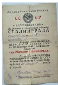
Рисунок 6. Удостоверение о награждении А.Т.Куценко

После разгрома фашистских войск под Сталинградом продолжалось победоносное шествие Советских войск по стране, освобождение городов и сел от немецко-фашистских захватчиков.