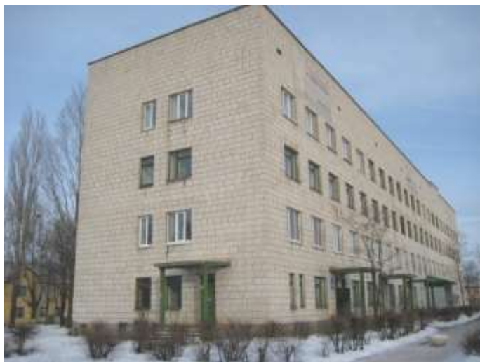
Железнодорожная поликлиника поселка Горьковский.

Поворачиваем направо, на улицу Волгоградскую. Слева в пятиэтажном доме находятся законодательные и правовые органы поселка, далее - железнодорожная поликлиника. За железнодорожной поликлиникой вы видите здание нашей школы, которой в этом году исполняется 63 года.