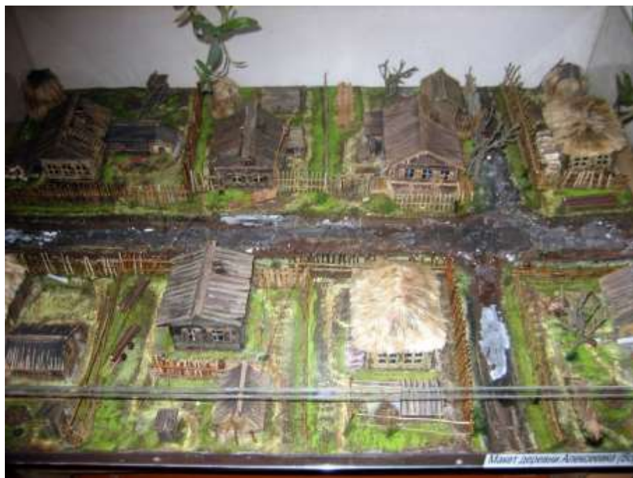
Реконструкция деревни Алексеевка.