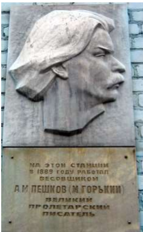
Мемориальная доска на здании станции.