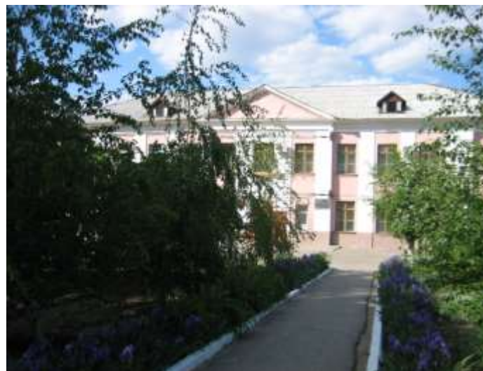
МОУ СШ № 8.

Мы поворачиваем на улицу Октябрьская, и направляемся к Братской могиле.