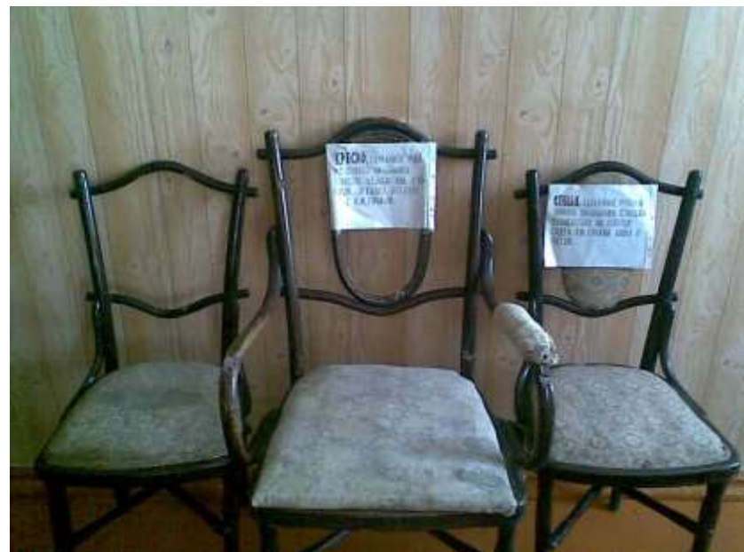
Кресла З.Е.Басаргина в музее Депо станции.

Итак, мы направляемся к первому объекту нашего небольшого путешествия по поселку.