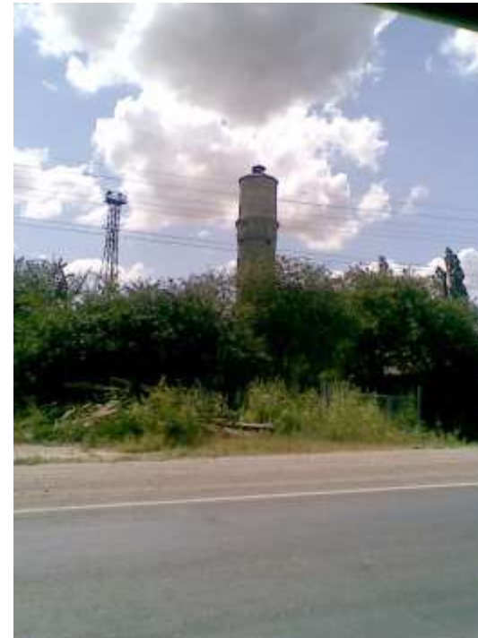
Водонапорная башня сегодня.