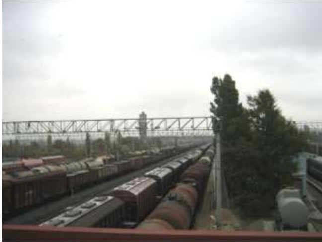
Вид на станцию с железнодорожного моста.