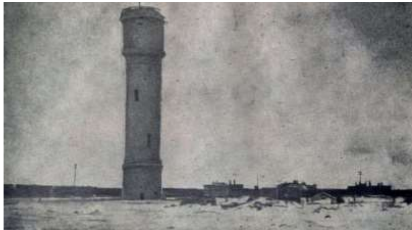
Водонапорная башня 1942г.

3-й экскурсовод. Перед нами водонапорная башня. Она была построена во второй половине 19 века для заправки паровозов. Жители станции пользовались водой из водокачек. В годы Великой отечественной войны она была военно-стратегическим объектом.