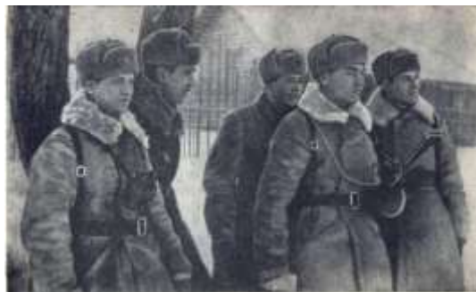
Бойцы 38 стрелковой дивизии. Воропоновский полк. 1943г.