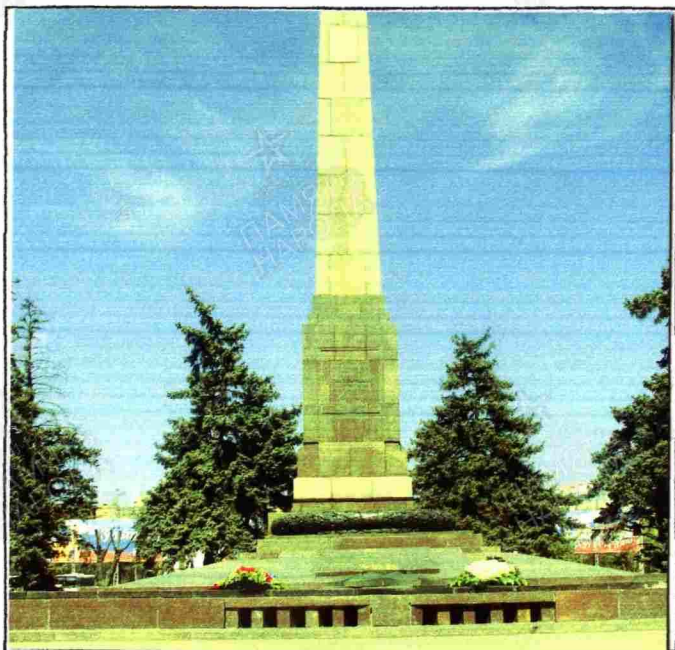
10. Дополнительная информация о захоронении