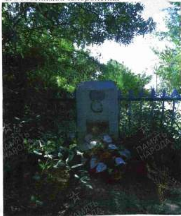
8. Фотоснимок захоронения